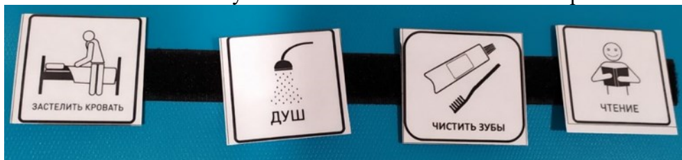
Рис.2 Расписание дня с карточкой «Чистить зубы»

• В течение дня обсуждать, что все чистят зубы, играть в чистку зубов куклам и игрушечным животным, читать книги о чистке зубов. Обсудить последствия отказа от чистки